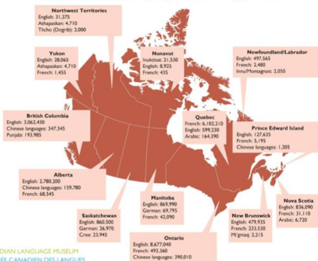
Top Three Mother Tongues Spoken by Province

La terre que nous appelons aujourd'hui 'Canada' a toujours été le foyer d'un éventail de voix bien diverses. Pendant des milliers d'années, les langues autochtones étaient les seules langues parlées d'une côte à l'autre du continent. Depuis le XVI ème siècle, le paysage linguistique du Canada a considérablement changé, en commençant par l'arrivée des premiers explorateurs et colons européens. Au fil du temps, les voix autochtones, immigrantes, anglaises et françaises se sont tissées pour créer ensemble une expérience linguistique uniquement canadienne. Tandis que nous trouvons au sein des langues autochtones des voix vraiment spécifiques au Canada, de nombreuses langues parmi les plus de 200 langues parlées au Canada, viennent d'ailleurs, créant ainsi une tapisserie faite de fils de toutes origines.